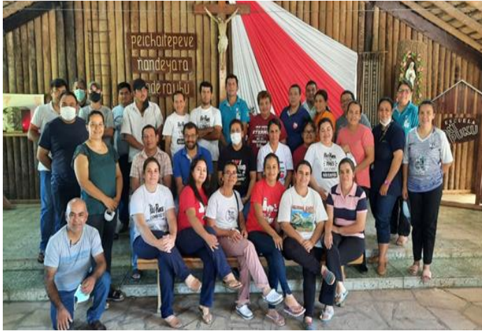
De wensen komen van de opvoeders van Pa 'I Puku, Paraguay.

Gracias por dar tanto! ¡Por ofrecer un poco de ti cada momento!